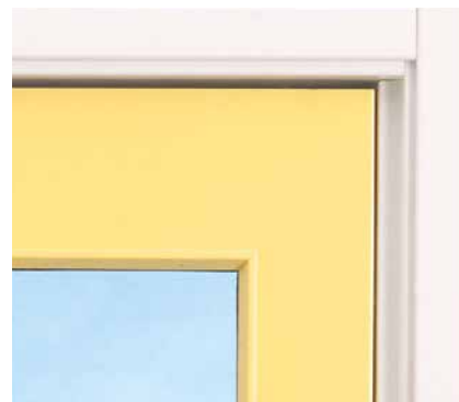
Pendeldörr T15 kan levereras med glasöppning.