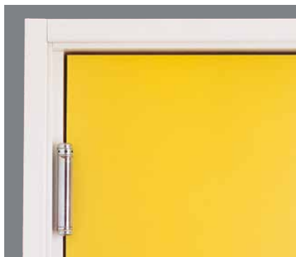
Skyddande kant runt om hela dörrbladet som både skyddar och gör det lätt att hålla rent.