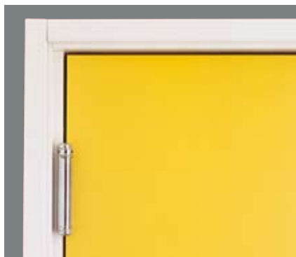
Skyddande kant runt om hela dörrbladet som både skyddar och gör det lätt att hålla rent.