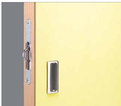
Infällt kant- och draghandtag.