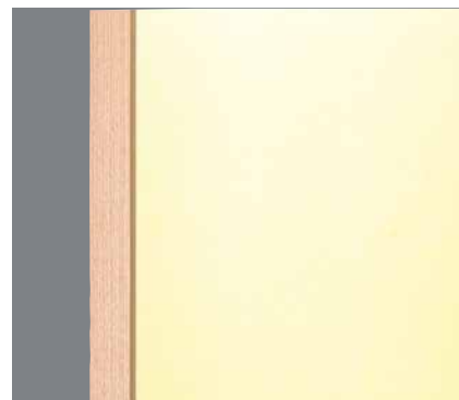
Skyddande kant runt om hela dörrbladet som både skyddar och gör det lätt att hålla rent.