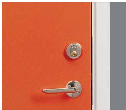
Låshus Assa Evolution.