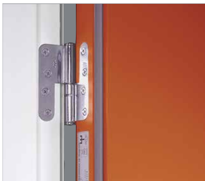
Skyddande kant runt om hela dörrbladet som både skyddar och gör det lätt att hålla rent.