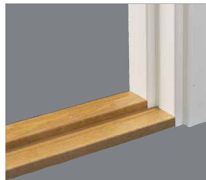
Tröskel av hårträ.