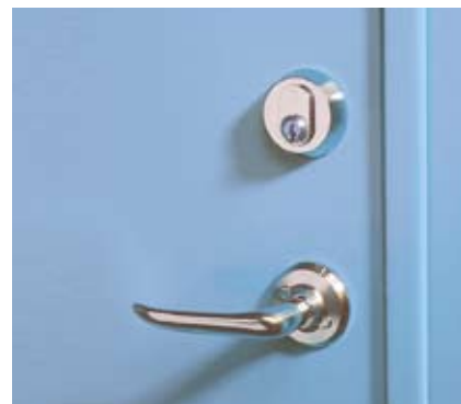
Pardörrsmöte med integrerat anslag.