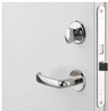
Låshus Assa 565.