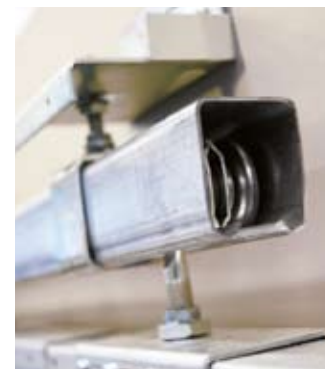
Justerbar skena och justerbara bärbeslag.