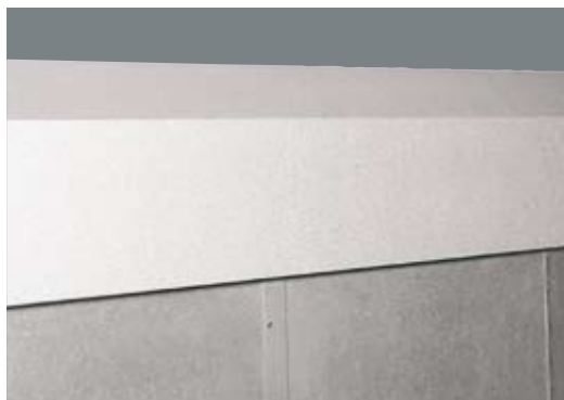
Bärskena och bärbeslag är skyddade av en kåpa.