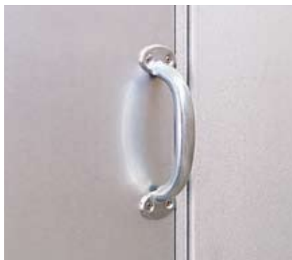
Utanpåliggande draghandtag på hängsidan och infällt på anslagssidan.