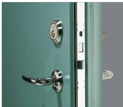
Flerpunktslås med hakregel i över- och underkant.