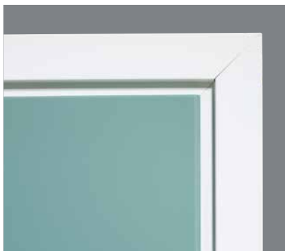
Överfalsen med en snedställd kant ger ett modernt och gediget intryck.