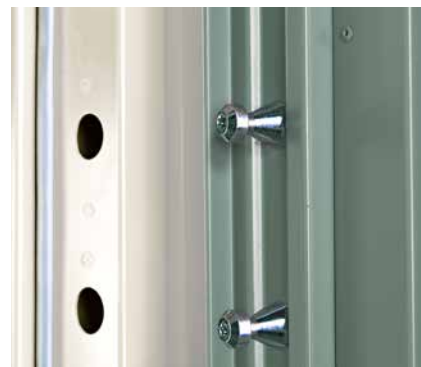
Hullingförsedda tappar i bakkant och gångjärn med säkrade sprintar ökar säkerheten.