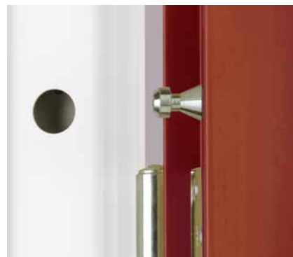
Hullingförsedda tappar i bakkant och gångjärn med säkrade sprintar ökar säkerheten.