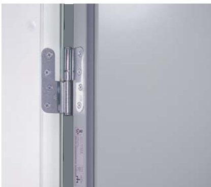
Skyddande kant runt om hela dörrbladet som både skyddar och gör det lätt att hålla rent.