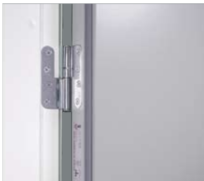
Skyddande kant runt om hela dörrbladet som både skyddar och gör det lätt att hålla rent.