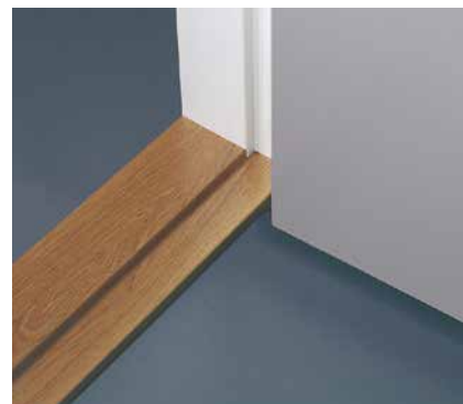
Tröskel av hårdträ.