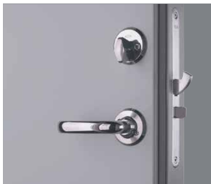
Låshus Assa 310.