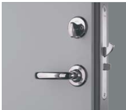
Låshus Assa Evolution 310.