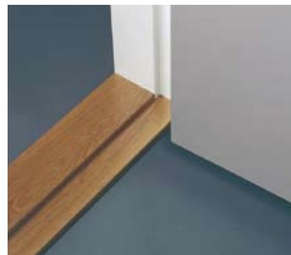
Tröskel av hårdträ.