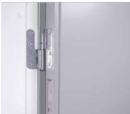
Skyddande kant runt om hela dörrbladet som både skyddar och gör det lätt att hålla rent.