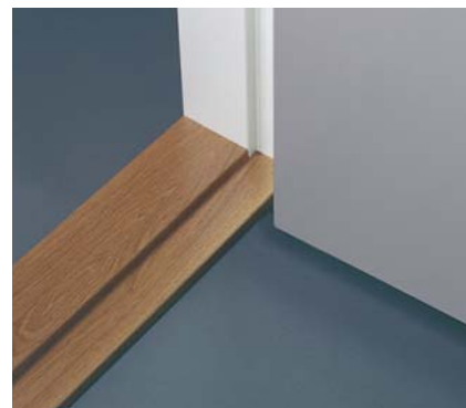
Tröskel av hårträ.