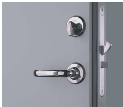
Låshus Assa Evolution 310.