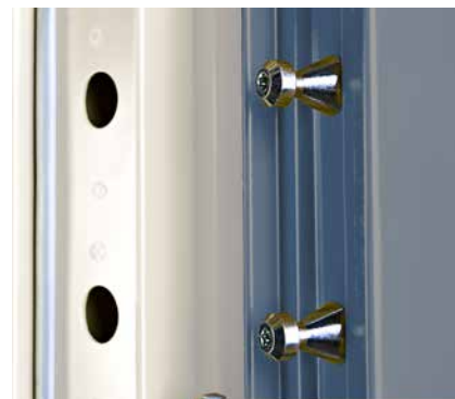
Hullingförsedda tappar i bakkant och gångjärn med säkrade sprintar ökar säkerheten.