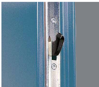
Säkerhetsdörr S44 har ett flerpunktslås där huvudlåset kompletteras med hakreglar upp- och nedtill.