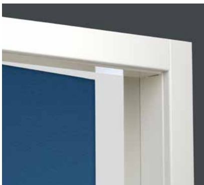
Den färdigisolerade karmen levereras med formbeständigt mdf-foder för invändig beklädnad.