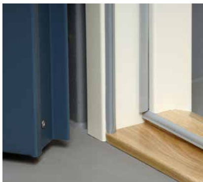
Dubbla tätningslister för hög ljudreduktion och täthet samt hårdträtröskel med dubbla lacklager är standard.