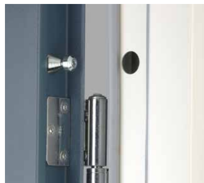
Hullingförsedda tappar i bakkant och gångjärn med säkrade sprintar ökar säkerheten.