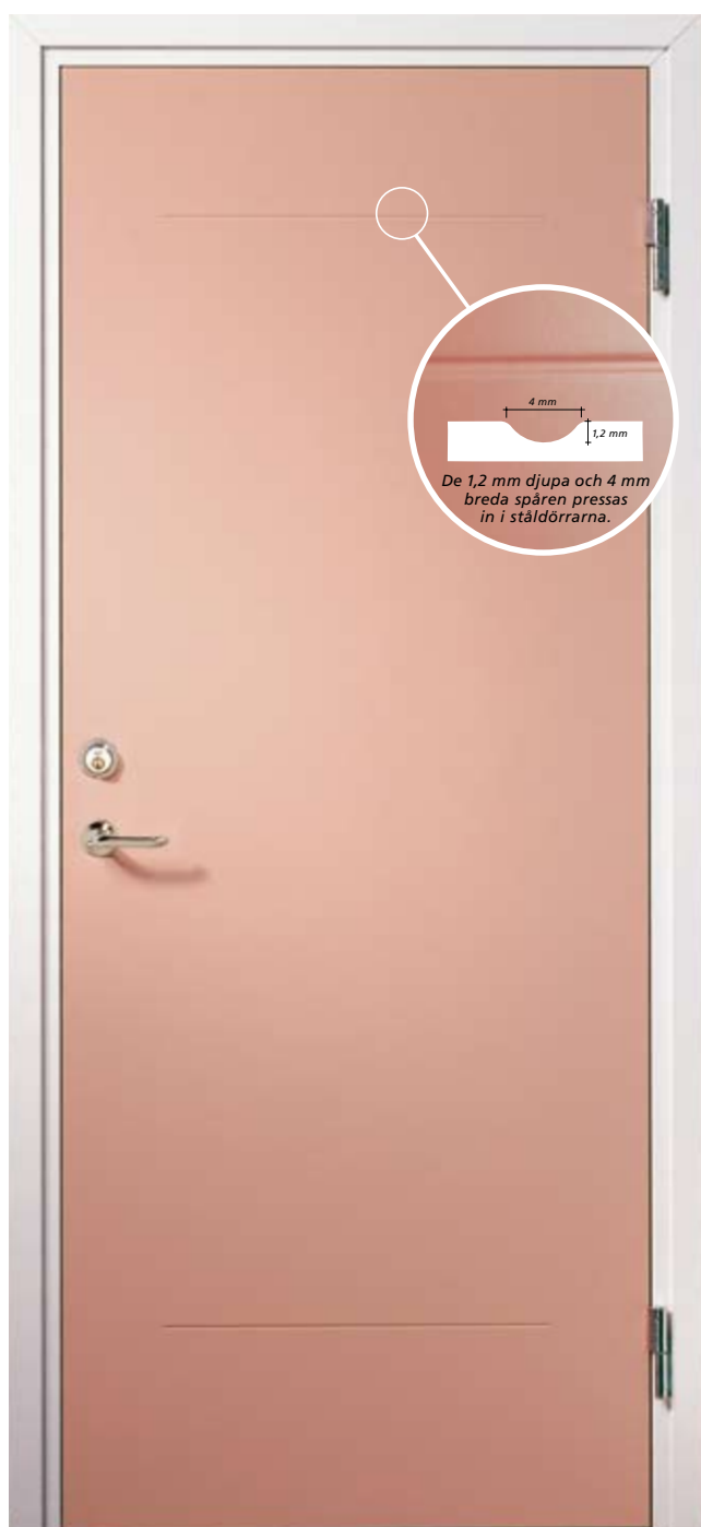
Ståldörr S20 med mönster 101

Daloc Linea-serien innehåller 29 olika mönster.