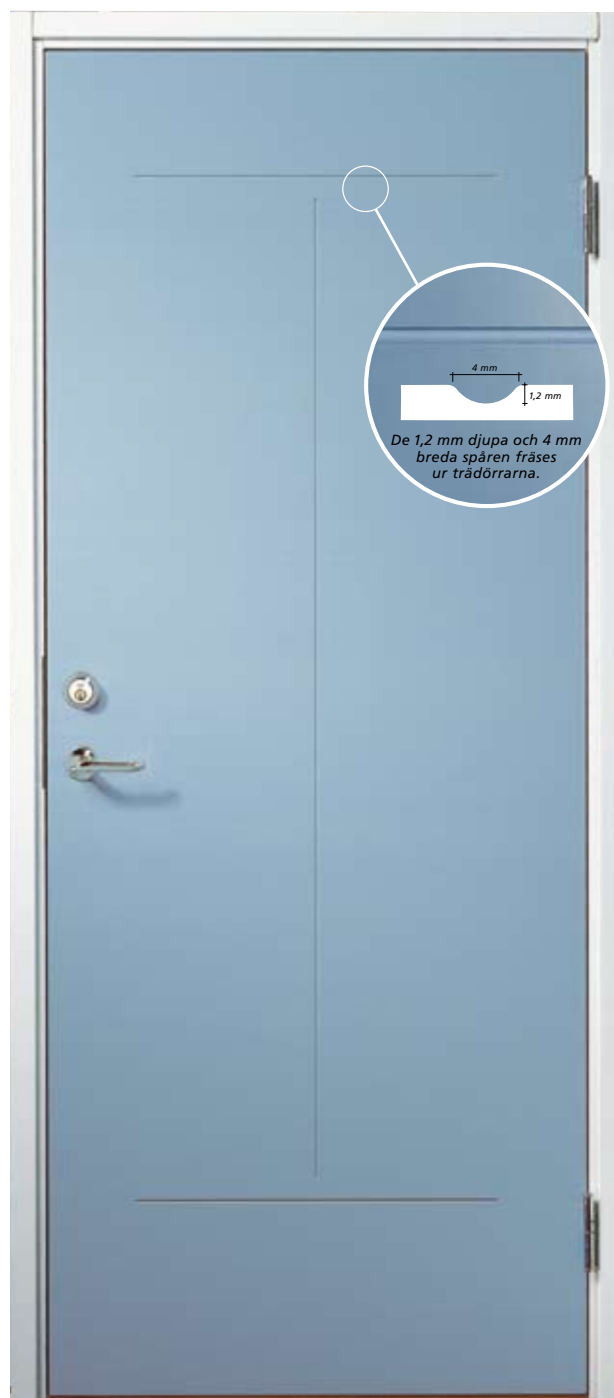
Tamburdörr T40 med mönster 121