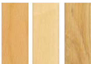
Bok Björk Ek