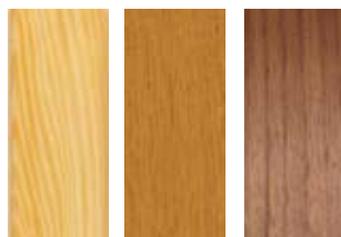
Furu Teak Valnöt