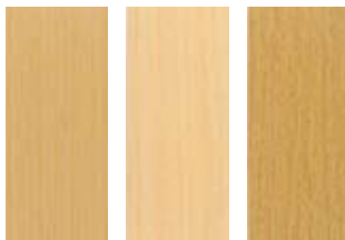
Bok Björk Ek