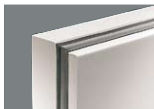
Melaminkantlist för dörrbladstjocklek 62 mm.

FAKTA MELAMINKANTLIST: 0,5 mm tjock melaminlist som appliceras genom högtryckslimning i speciella kantbearbetningsmaskiner för jämn och hög kvalitet. Listen är helt slät med dörrytan. Listen målas tillsammans med dörren i övrigt.