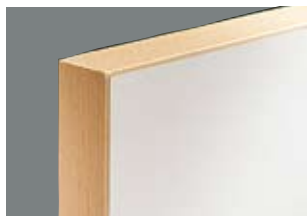
Kantlist för dörrbladstjocklek 41 mm.