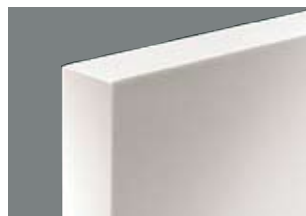
Melaminkantlist för dörrbladstjocklek 41 mm.