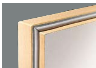
Kantlist för dörrbladstjocklek 62 mm.

FAKTA KANTLIST: Dörrbladen levereras som standard med 3 mm tjock kantlist av genommonstrad ABS-plast. 3 mm klarlackad träkantlist levereras som tillval. Underfals på dörrblad med tjockleken 62 mm förses med 0,6 mm ABS- eller fanerkantlist. Kantlisterna appliceras genom högtryckslimning i speciella kantbearbetningsmaskiner för jämn och hög kvalitet.