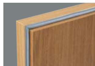
Fanerad kantlist för dörrbladstjocklek 62 mm.

FAKTA FANERAD KANTLIST: 0,6 mm fanerlist som appliceras genom högtryckslimning i speciella kantbearbetningsmaskiner för jämn och hög kvalitet.